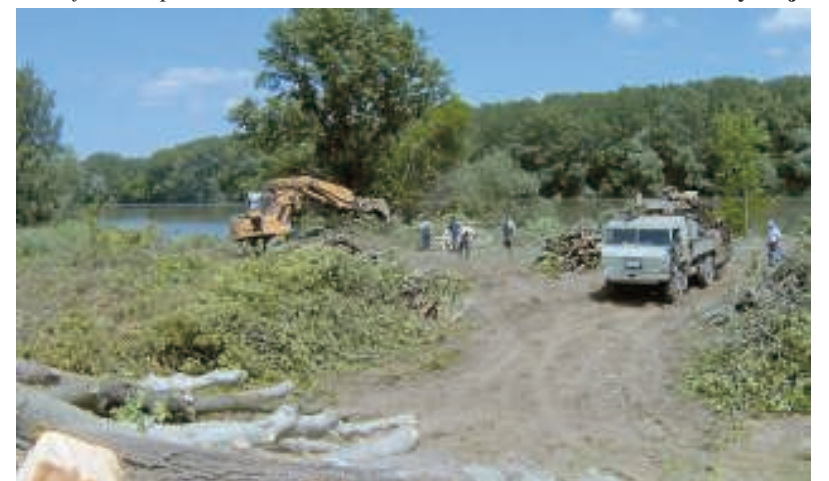
Терептисџтјат а адаи тизсаи хиднал / Рашчишћавање терена за мост на Тиси код Аде