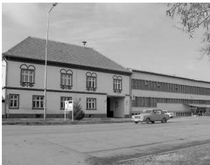
Индустрија меса „Чока“ / А csókai Húsfeldolgozó

А csókai Húsfeldolgozóba a napokban érkezett meg a teljes hűtőberendezés-rendszer Ausztriából. A York cég a kivitelező, az a cég, amely egy nemzetközi konzorcium részeként