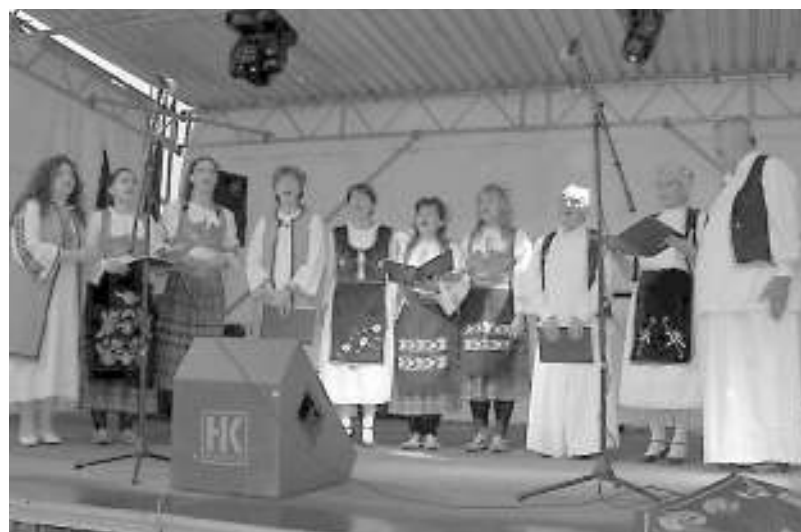
„Чокански славуји“ Певачка група КУД „Свети Сава“ / A „csókai csalóányok“, a Szent Száva Művelődési Egyesület énekkara