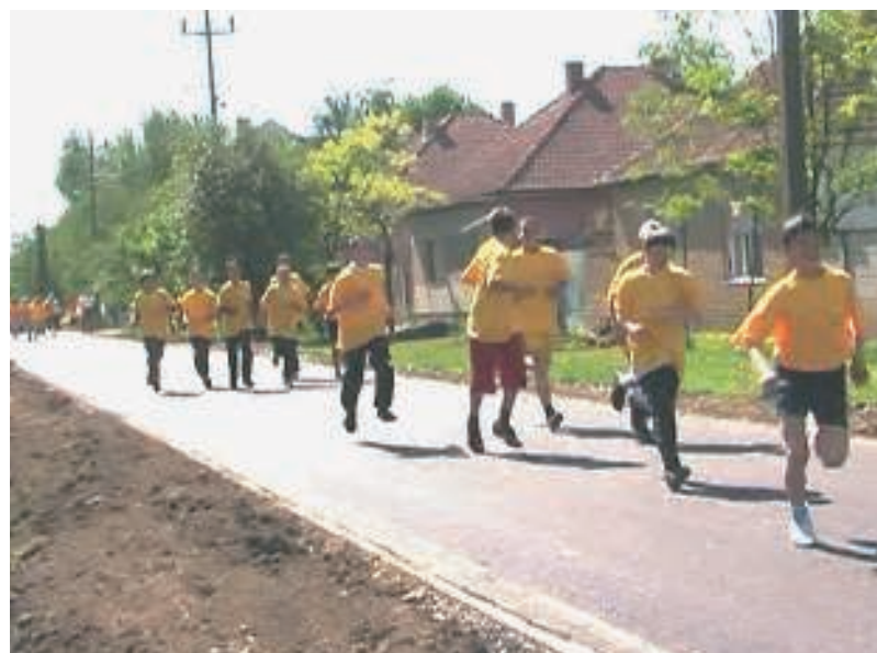
Футџверсени а Нјегош џтца асфалтјан, Падеј /Крос на асфалтју улице Његош, Падеј Крос на новом путу