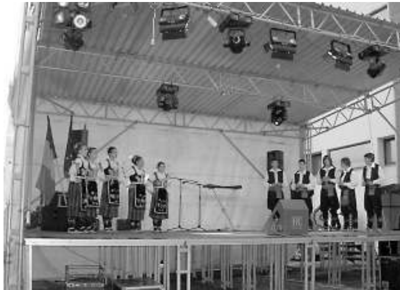
КУД „Вук Караџић“ из Канада на позорници у Деџи / A szanádi Vuk Karadžić Művelődési Egyesület a dettai színpadon

лизација незваничног програма боравка Чокана у Дети.