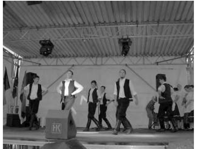
Плесачи КУД „Мора Ференц“ одушевили жледалиштје / A Móra Ferenc Művelődési Egyesület táncosai lenyűgözték a közönséget

Az éjszakai élénk események viszont nem befolyásolták a napközben tervezett hivatalos programokat. A háziak bemutatták vendégeiknek a