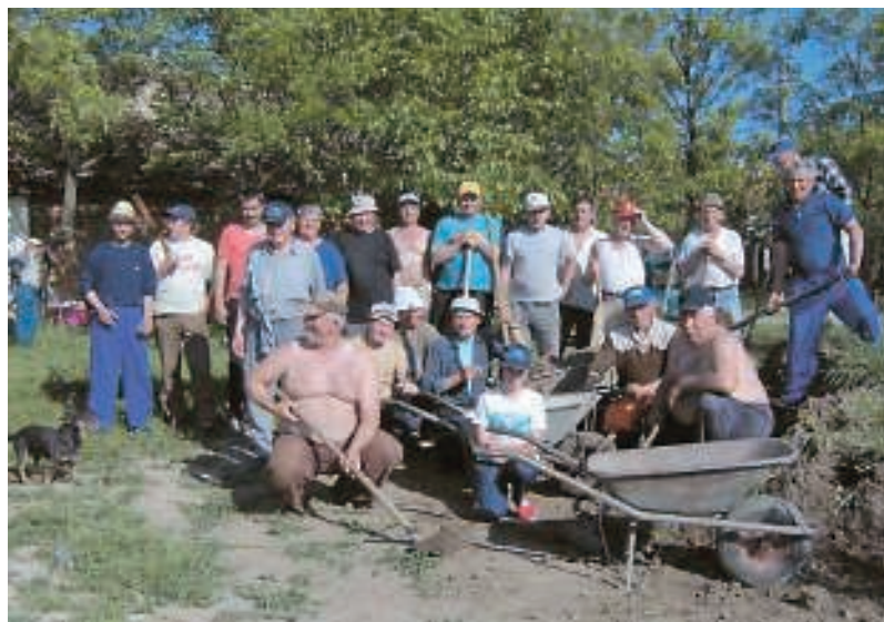
Акцијаши на језеру „Јамурина“ / А Nagyödör тó védői

Ефикасном акцијом припадника полицијске станице у Чоки откривени су починиоци вандалског чина на обали језера Јамурина, када је поломљено 16 вишегодишњих садница разног дрвећа, уништена огласна табла и обијен сандук са струјомером крај једине јавне чесме у Чоки. Починиоци су, према изјави полиције, старији малолетници из Чоке који су највероватније под утицајем алкохола и опојних средстава приредили овај пир у ноћним сатима. Против починилаца поднете су пријаве надлежним правосудним органима.