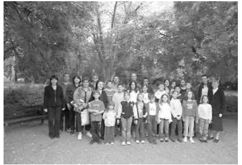
Együtt a csapat

Szakmai képzés anyagát képezte a gregorián szemiológia, kórushangképzés, gregorián történet, liturgikai alapismeretek. Mindenki számára fontos volt, hogy első kézből kapják az