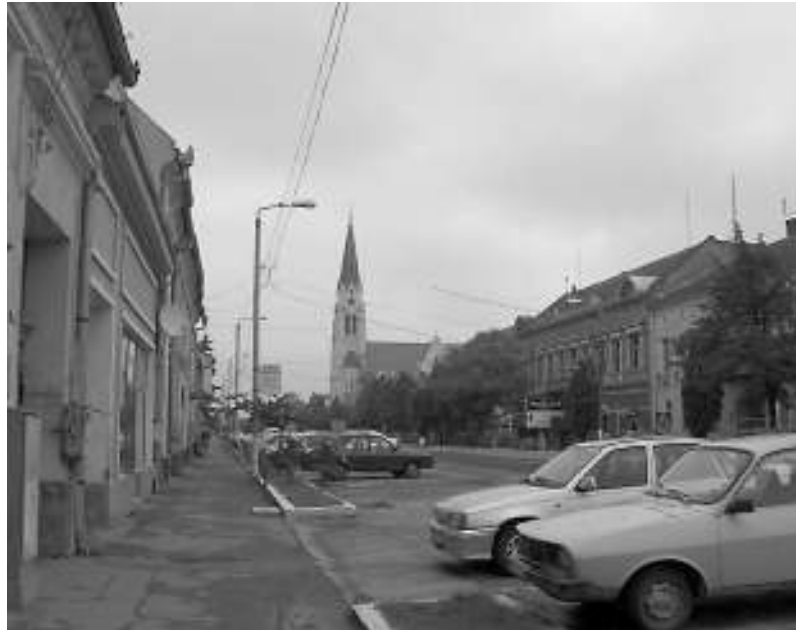
Деџа, брајтски жрад у Румунију / A romániai Detta városa

Шездесеточлана експедиција културних и јавних посленика општине Чока посетила је у време од 18. до 20. маја ове године град Дету у Румунији у оквиру реализације заједничког пројекта „From football to food ball“. Представници културно уметничких друштава „Вук Караџић“ из Канада, „Мора Ференц“ и „Свети Сава“ из Чоке, наступили су на отвореној сцени у центру Дете у вишечасовном културном програму сатканом од песама и игара заједно са члановима културно уметничких друштава из Дете који негују румунски, мађарски и бугарски мелос. Киша, која је све време боравка бројне делегације из Чоке падала, није умањила значај овог изузетног културног догађаја у древној Дете која се налази на средокраћу царског пута између Вршца и Темишвара. Више стотина покусних гледалаца громким аплаузима и правим овацима награђивала је сваку изведену фолклорну или музичку тачку, а сви учесници су им се одужили квалитетним извођењем на којима би им позавидела и многа професионална културно уметничка друштва.