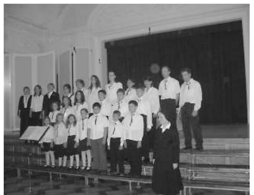
Bárdos Lajos Zenei Hetek egyik rendezvényén